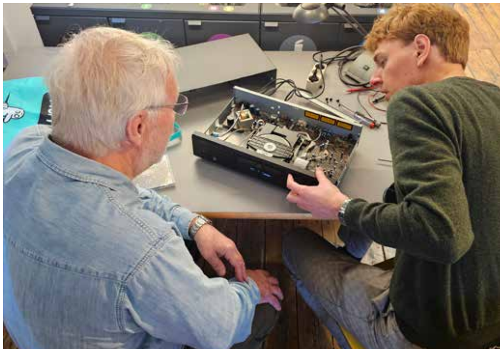
Repair Café Amager holder til på 2. sal i Kvarterhuset

Hvis du har lyst til at være en del af fællesskabet i Repair Café Amager kan du kontakte caroline@miljopunkt-amager.dk og sende en kort beskrivelse af dig selv (maksimum 10 linjer).