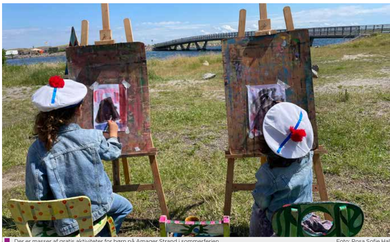
Der er masser af gratis aktiviteter for børn på Amager Strand i sommerferien

Sommer på Stranden er igen i år scene for børnekonserter under Copenhagen Jazz Festival. Lørdag 5. juli spil-