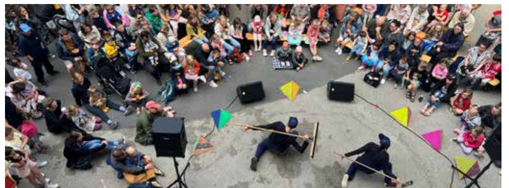
Der er masser af gratis og billige sommeroplevelser for børn og familier i løbet af sommeren

Sommerens program byder på masser af sjove og sanselige oplevelser på bydelens bemandede legepladser. I slutningen af august kan man opleve den musikalske ny-cirkusforestilling Grand Danois i Lergravsparken.