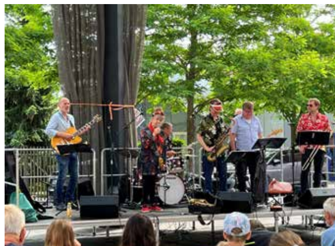
Live Music at Musiktorvet

In July, Børnekulturhuset moves to the beach along Øresundsstien. Every day from 10:00 to 17:00, children can take part in concerts,