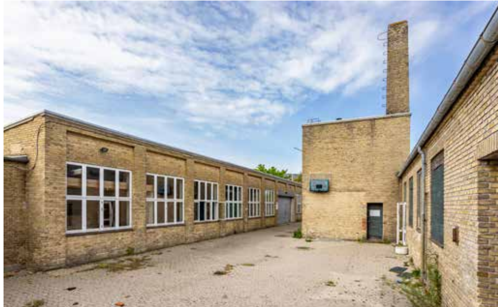
Flere af de gamle industribygninger vil blive en del af det nye byggeri ved Femøren Station

I dag fremstår området med graffiti, tomme bygninger og spor fra den tidligere