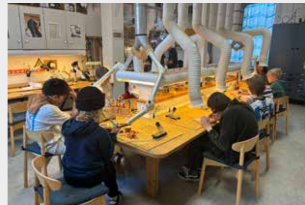
Børn i fuld gang med at lodde

Unge skaber fællesskab gennem lodning og leg i Skramloteket