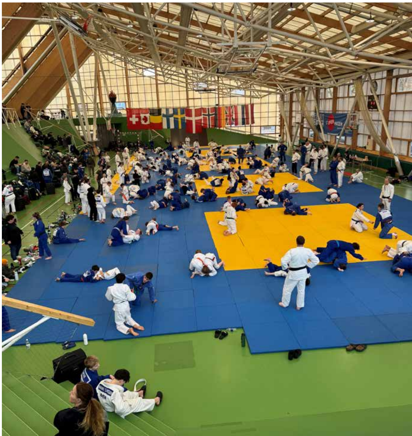
Amager Judo Skole holdt for 12. gang Copenhagen Judo Open i påsken

Amager Judo Skole havde netop deltaget i en turnering i Warszawa med 2.300 judoøvere fra mere end 35 lande . Klubben vurderede, at Copenhagen Judo Open kunne nå 2.000 deltagere inden for få år - til gavn for sporten og for lokalområdets mange erhvervsdrivende - hvis de fysiske rammer kunne følge med.