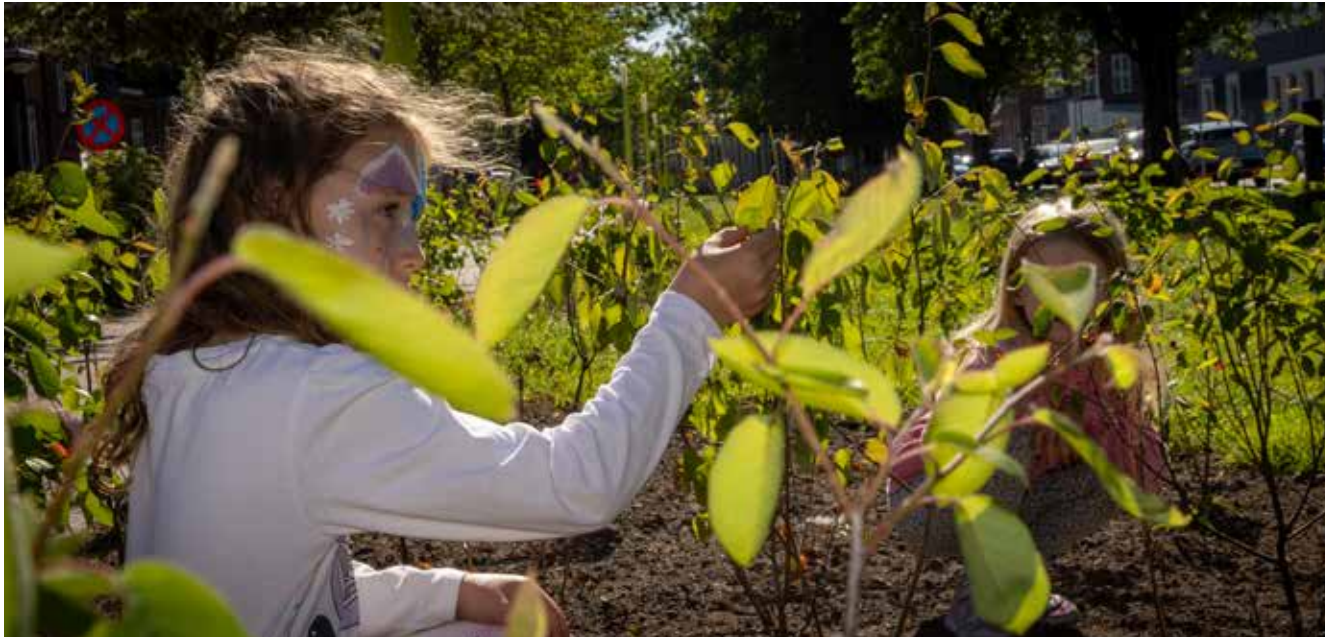
Du kan også være med til at styrke biodiversiteten i byen

Bynatur handler ikke kun om æstetik. Forskning peger på, at grønne områder i byen bidrager til bedre mental trivsel, stærkere fællesskaber og et rigere dyreliv