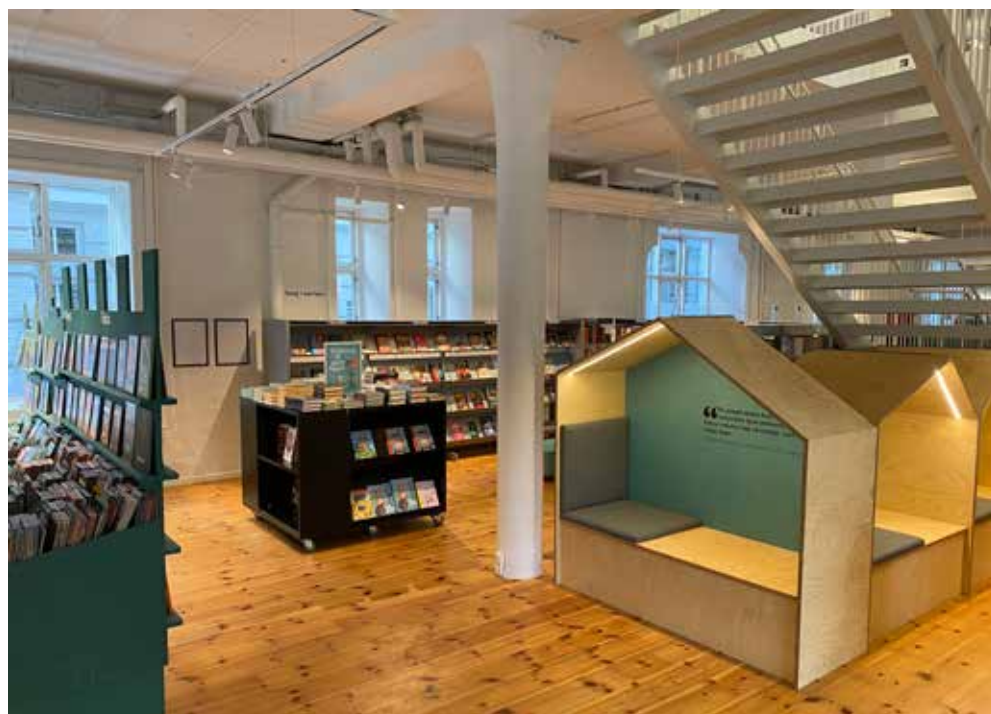
■ Sundby Bibliotek får flere ansatte og længere bemandet åbningstid

Kommunen vil efterfølgende følge udviklingen i blandt andet besøgstal, udlån og brugertilfredshed for at vurdere, om indsatsen virker efter hensigten.