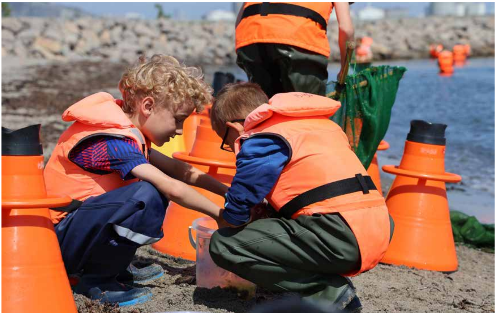
Mange flere børn og familier vil kunne lære om naturen på Amager Strand

Med Havkraft får endnu flere børn, unge og familier mulighed for at deltage i aktiviteter ved vandet og opleve naturen som en del af deres hverdag. Projektet skal styrke fællesskaber og gøre det lettere for flere at