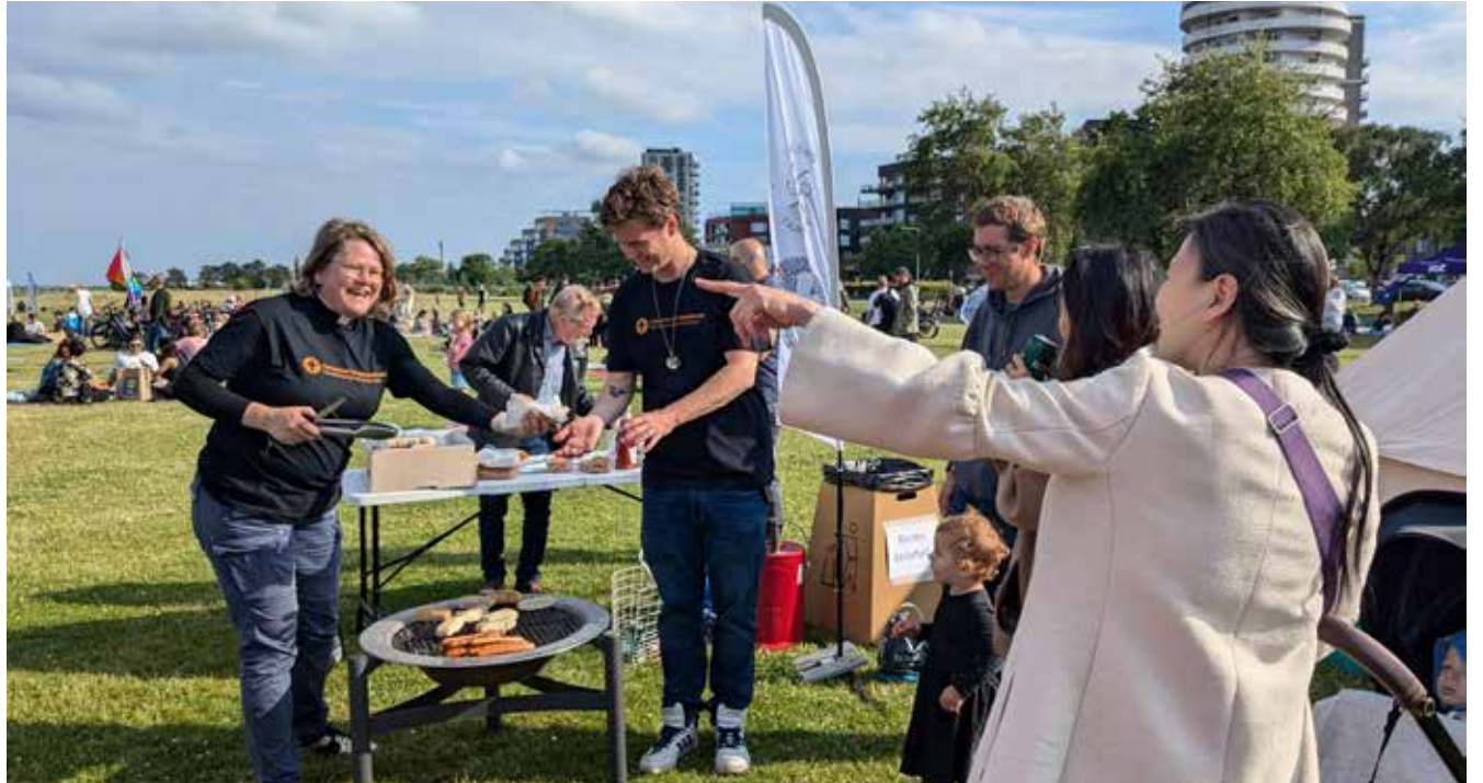
The churches on Amager invite families to join the Sankt Hans event at Amager Strand

Where: The church Tent, at Amager Beach, close to Øresund Metro Station When: SKT. HANS 23 June from 17 and onwards - BABYSALMESANG every Wednesday from 24 June to 26 August at 11 am.