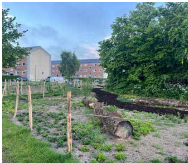
Har du været forbi det nye grønne åndehul på hjørnet af Greisvej og Engvej?

Engen er etableret på 1800 m 2 kommunal jord med støtte fra LB-Foreningen og Nordea Fonden.