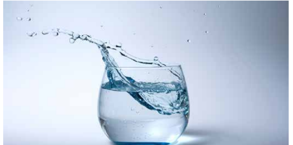
Lad os sammen passe på denne livsvigtige ressource, så vand er rent og tilgængelig for alle nu og i fremtiden

I Danmark tager vi rent drikkevand fra hanen for givet. Men det er ikke sikkert, at det fremover vil være muligt alle steder i landet, medmindre vi passer bedre på vores grundvand. Det er derfor