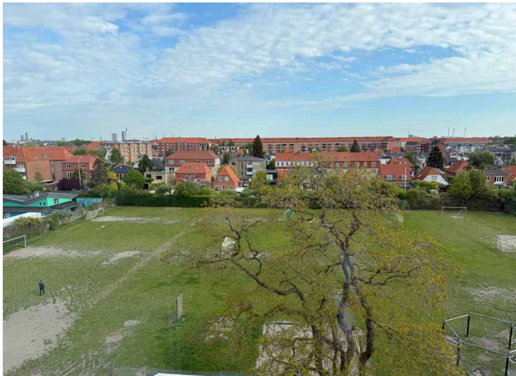
Idrætsfaciliteterne vil få et tiltrængt løft med en idrætshal og kunstgræsbaner