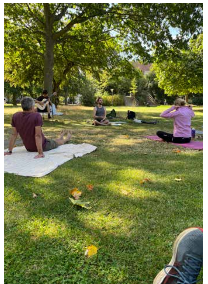
GuitarYoga i Lergravsparken 2025