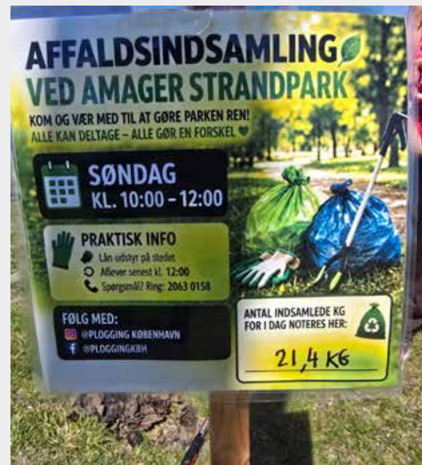
Der blev indsamlet 21,4 kg affald i Amager Strandpark

Frivillig forening udvider sine aktiviteter til Amager: Affaldsindsamling i Amager Strandpark