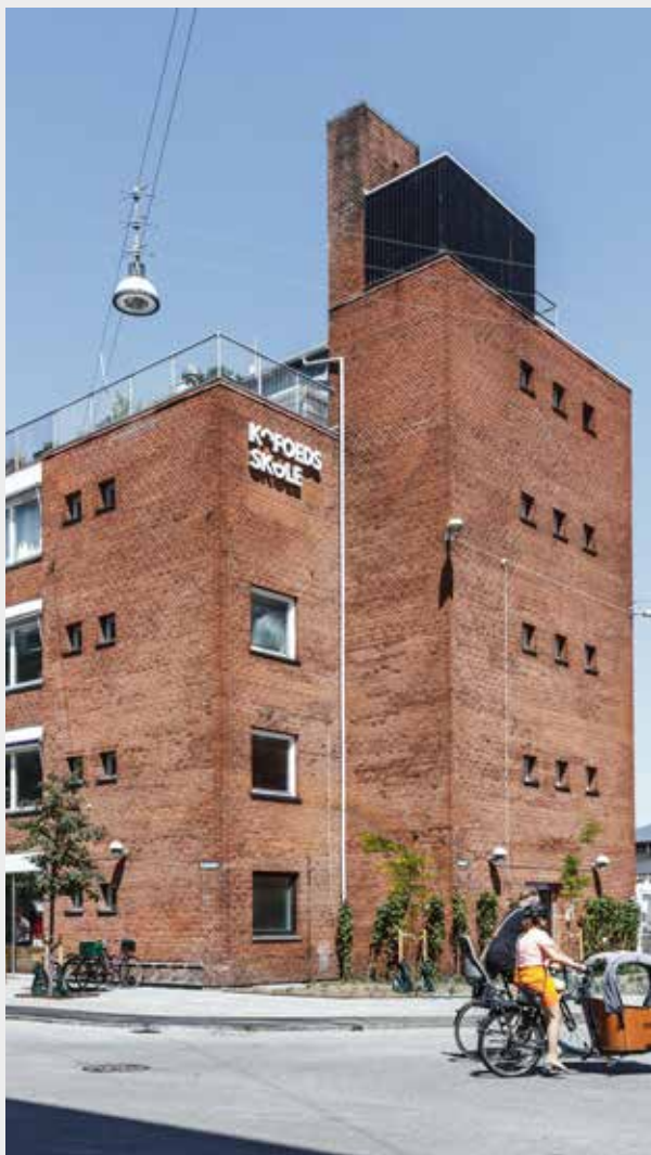
■ Kofoeds Skole