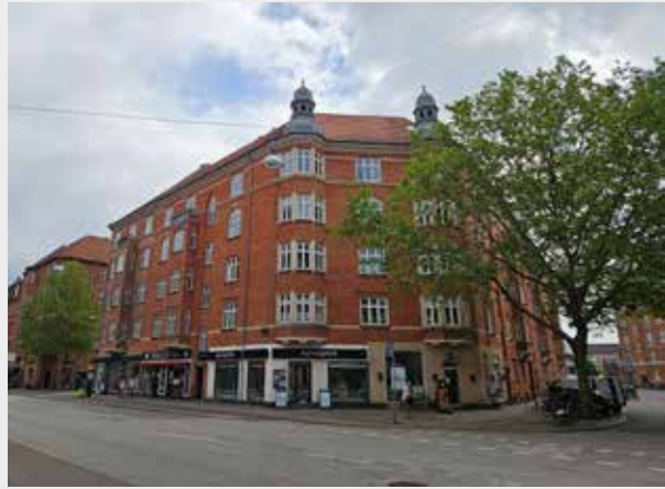
Valdemar Dan har tegnet flere ejendomme på Amagerbro

Kunst- og arkitekturgruppen inviterer interesserede Amager Øst-borgere til en byvandring søndag 23. august 2026