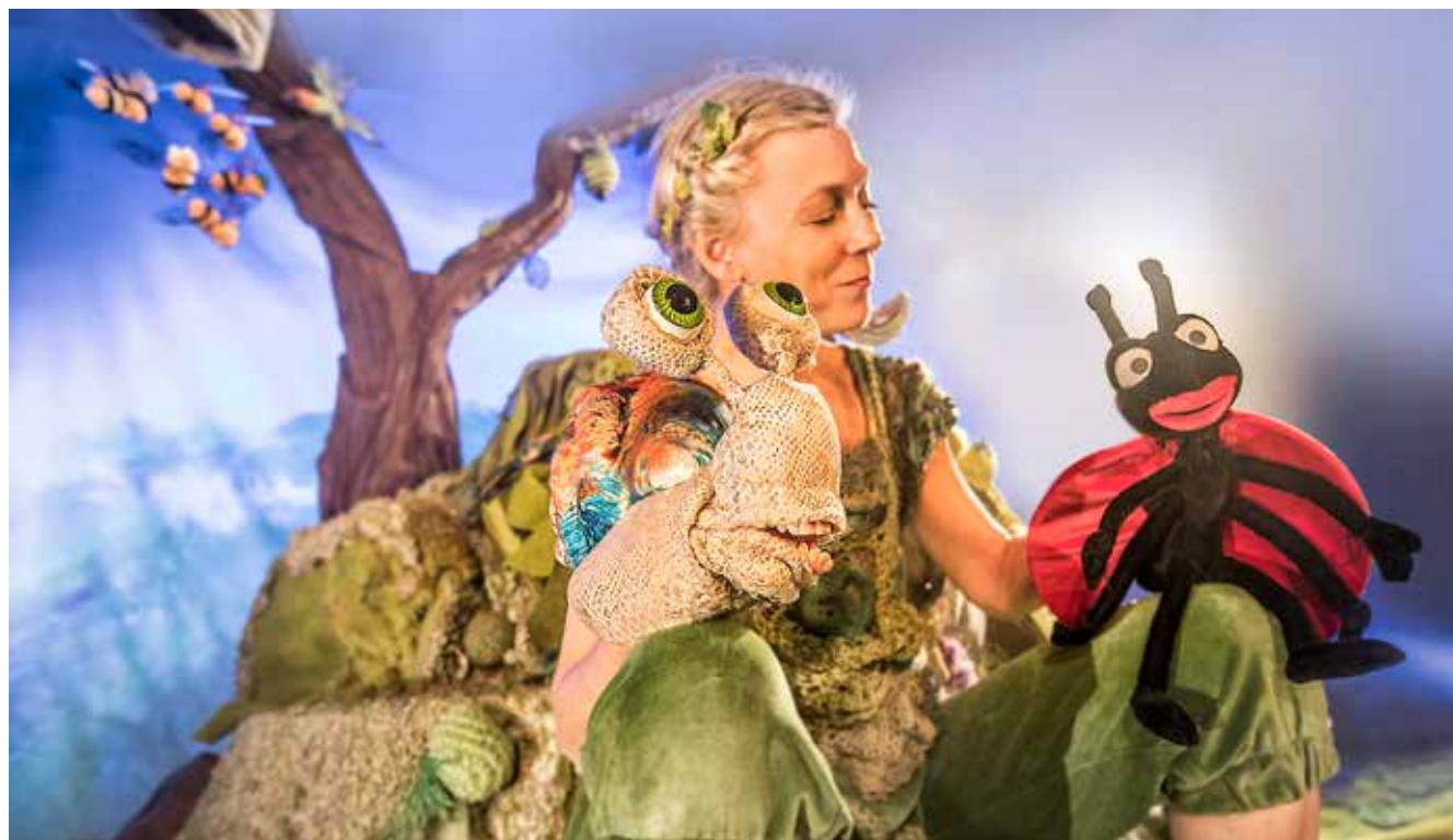
Oplev Mariehønen Evigglad af Teater ZeBU og Sjællands Teater for de 2-5-årige, når den spiller fra 11. – 30. maj 2027

Teenagerne bliver forkælet med en danmarkspremiere, når forestillingen Hvor mange vinkler har en trekant? får premiere fra 22. februar – 12. marts 2027. Et råt drama der sætter fokus på samtykke: Venner eller kærester? Lyst eller ikke lyst? Forestillingen griber fat i relevante problematikker for de unge om, hvordan en uskyldig aften blandt venner