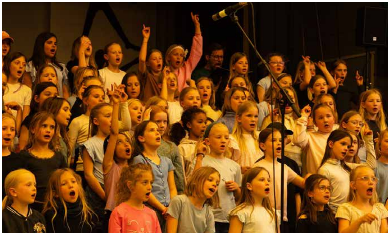
Musik og kor skaber fællesskab