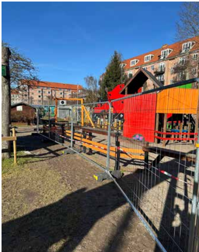
Afspærrede legeredskaber på Bredegrund