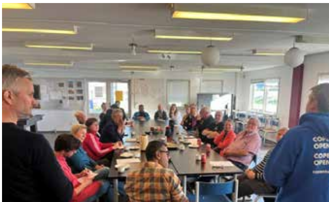
Idrætsnetværket fremlægger her Amager Øst Lokaludvalgs visioner og virkelighed for de kommunale politikere

Lokaludvalget havde i samarbejde med Idrætsnetværket inviteret politikerne fra Kultur, Fritids og Borgerserviceudvalget til møde på Kløvermarken for at vise området frem og fortælle om udfordringer og ønsker i bydelen