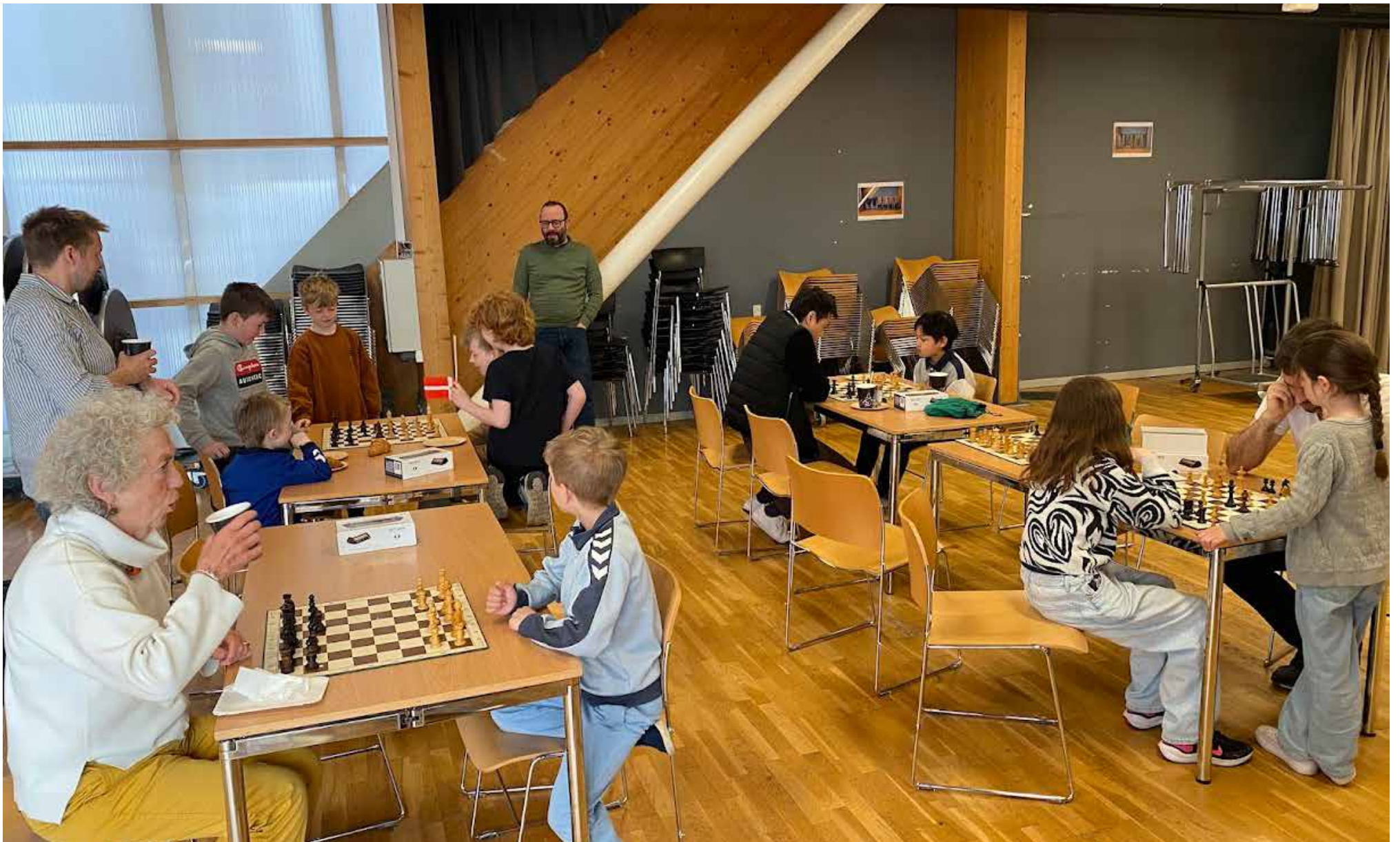
Amager Skakforening fejrer i år sit 100 års jubilæum

I år har der været flyttet bønder og konger på Amager i 100 år, og Amager Skakforening har her i foråret taget fat på fejringen af 100-års jubilæet og fortsætter resten af året med forskellige skakaktiviteter