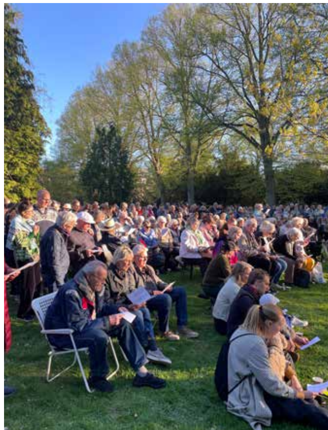
Endnu en gang var der stor tilslutning til 4. maj-arrangementet på Sundby Kirkegård

"Faldet i Danmarks frihedskamp 1940-1945". Æresmindet er enten placeret på gravstenen eller på en flad sten foran. I dag findes der omkring 750 fredede grave for modstandsfolk fordelt på 191 kirkegårde over hele landet.