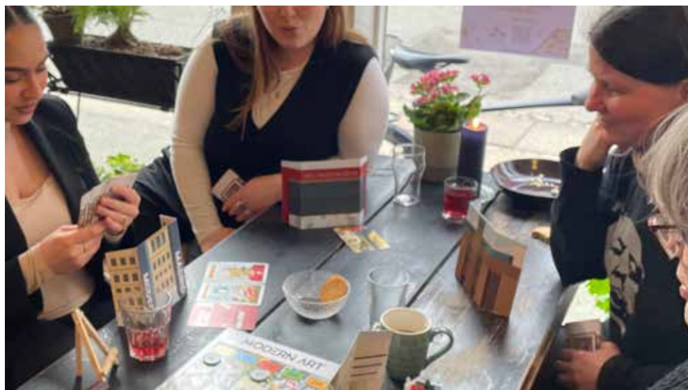
Der er brætspilscafé i Folkehuset Matriklen hver onsdag.

For børnefamilierne har caféen også vist sig at være en kærtkommen anledning til at prioritere tid sammen på en anden måde: “Det er alt for sjældent, vi sætter os ned og spiller et spil derhjemme sammen som familie. Vi burde helt sikkert gøre det noget mere, men det er rart, at der er et sted, hvor vi kan vælge det til,” fortæller en deltager.