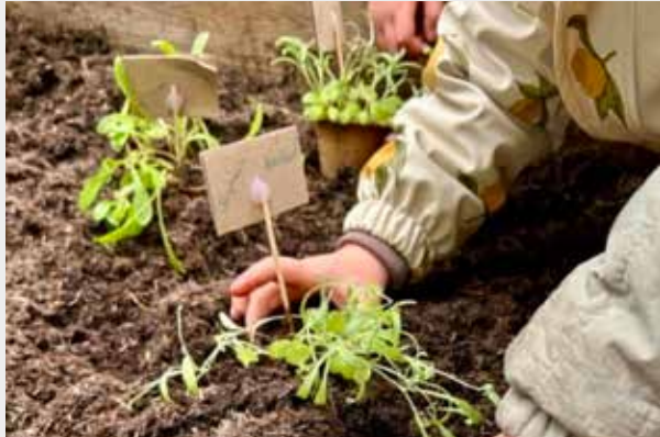
De lokale børnehaver har været i gang med at så frø fra frøbanken.

Kattehale, Hvid Okseøje, Kornblomst, Rejnfan, Vild Gulerod og Rødkløver. Disse seks, hjemmehørende arter er efterhånden blevet fast inventar i kulturhuse og biblioteker rundt om på Amager