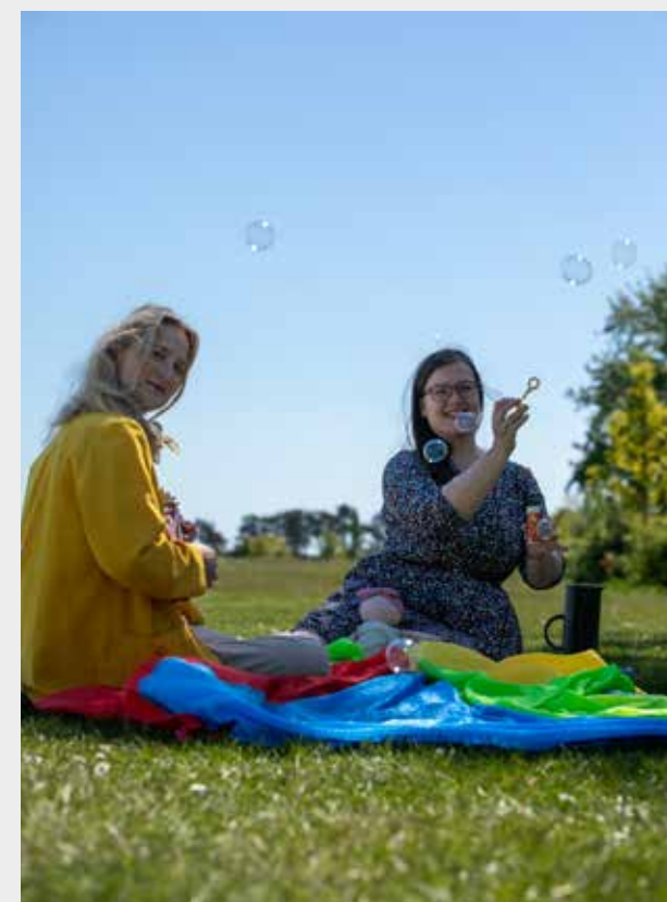
■ Babysalmesang på Amager Strand hver onsdag fra 24.6

Sankt Hans kender vi. Bål på stranden, lange lyse aftener, sange og taler, børn der løber barfodede i græsset. Lad os invitere vores internationale naboer med til Sankt Hans på engelsk