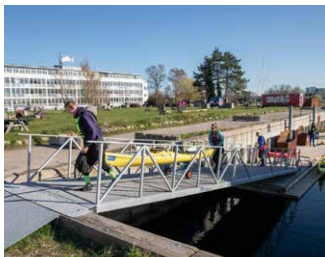
Overbæring for kajaker ved Refshaleøen

Selve flydebroen og slæbestedet kan benyttes af alle