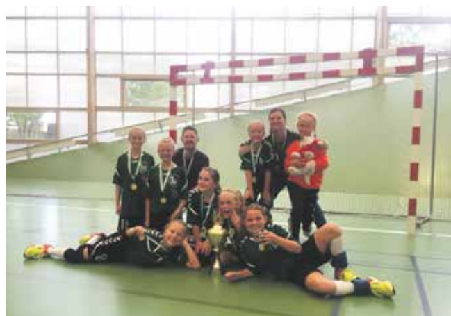
U10 Pigerne fra Tårnby HK får overrakt medaljer og pokal som vinder af Amager Cup 2018, i Prismen

Klubberne er meget positivt overrasket over, hvor hurtigt klubberne har formået at stable et velbesøgt stævne på benene, særligt i en periode hvor der er kommet flere opstartsstævner at konkurrere med. Charlotte Melton Amager SK's kommunikationsansvarlige siger: "Det er utrolig vigtigt, at et nyt stævne som Amager