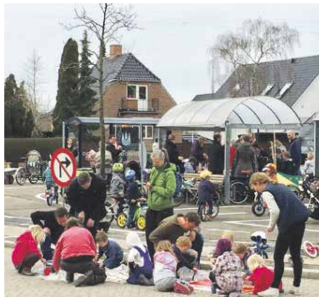
Billede fra den allerførste arbejdsdag på Trafiklegepladsen i april 2016

en bygning på pladsen. Børnecyklarne kan afleveres på Kongovej 11 eller Delosvej 27.