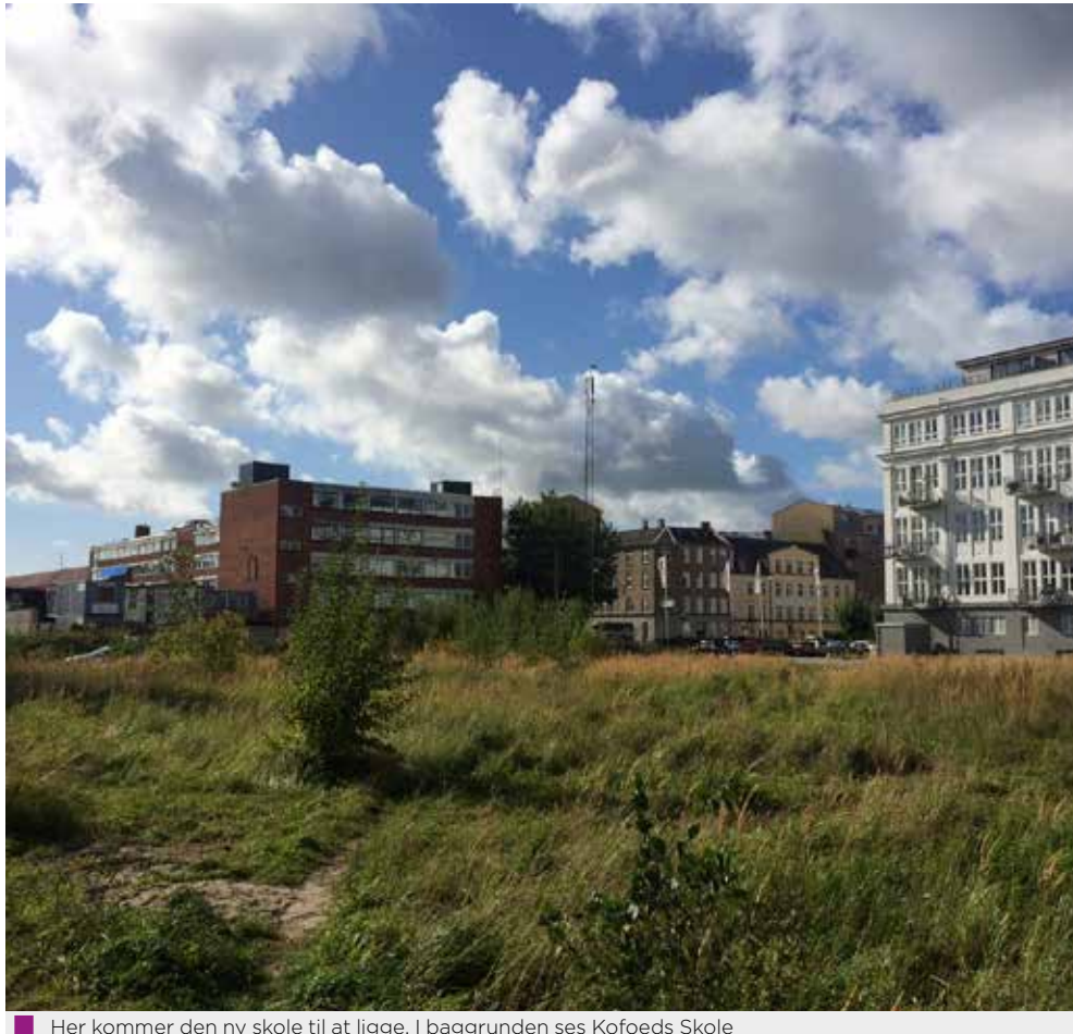
Her kommer den nye skole til at ligge. I baggrunden ses Kofoeds Skole

I forbindelse med arbejdet med at udvikle Kløvermarken er der afsat 1 mio. kr. til en foranalyse vedr. Ketsjersportens Hus. Heri indgår undersøgelse af mulige placeringer, samt af hvordan huset kan udformes og finansieres. Desuden er der afsat 0,7 mio. kr. til en planlægningsbevilling til nybyggeri af omklædnings-