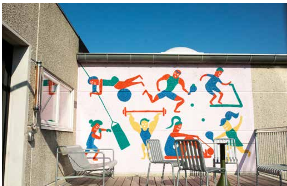
Et sjovt billede på væggen hos et af områdets træningscentre.