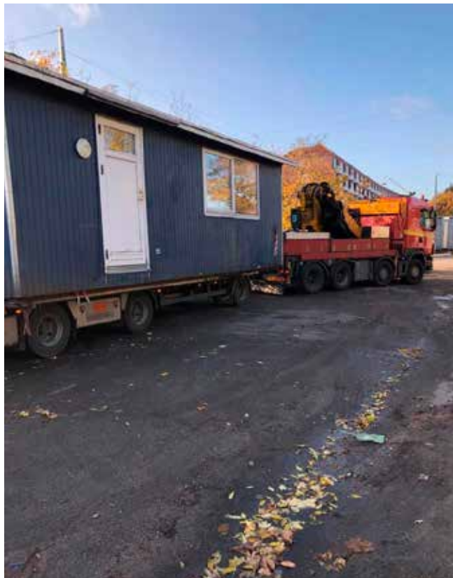
Et af de små huse i Vermlandsgade køres væk

Derfor er det glædeligt, at det nu viser sig, at Kofoeds