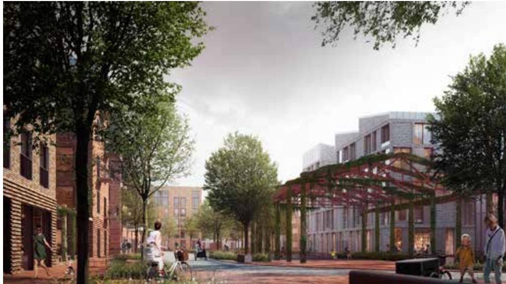
Illustration af den centrale plads i området

Der var også ros til den planlagte daginstitution. Det er ikke en naturlov at det bliver taget med ind fra start. Vi finder det dog uheldigt, at det centrale torv delvist indtages til legeplads for daginstitutionen.