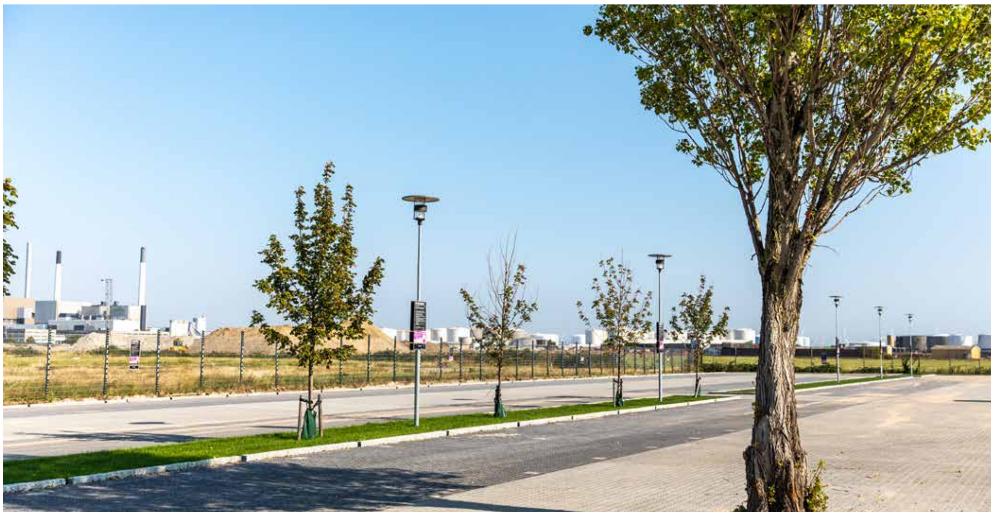
Den nye parkeringsplads, anlagt rundt om det smukke træ for at bevare områdets beplantning. Der skal sås vilde blomster i grøften ved heget.

Bygningerne i Kløverbyen har haft en rig historie og huset mange forskellige brancher gennem årene og var oprindeligt ejet af De danske Spritfabrikker tilbage i 1975 - en del af den industrielle danske kulturarv. I dag er Kløverbyen en base for diverse kreative virksomheder, fordelt på forskellige brancher. Den store mangfoldighed af virksomheder er med til at skabe et unikt og dynamisk miljø på grunden. Visionen for området er på sigt at skabe en bæredygtig bydel med fokus på solenergi.