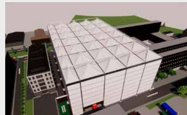
Illustration af byggepladsen, der er dækket af et såkaldt SiteCover®. NCC/Københavns Kommune.

Byggeriet af Nordøstamager Skole i Holmbladsgade sættes nu i gang