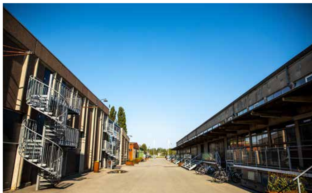
Et kig ned ad Tapperistræde, som er navngivet efter bygningen til højre, De Danske Spritfabrikkers tidligere tapperihal - i dag TAPI.