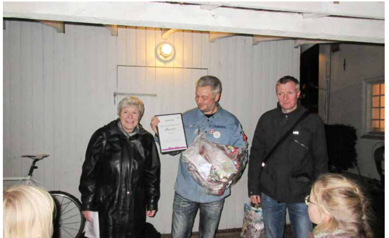
FDF K 13 modtager diplomet for årets frivilligpris

FDF K 13 og Amager SK er udvalgt som årets vindere, og modtager hver 25.000 kr. Prisen blev overrakt af lokaludvalgets bedømmelseskomite i november måned