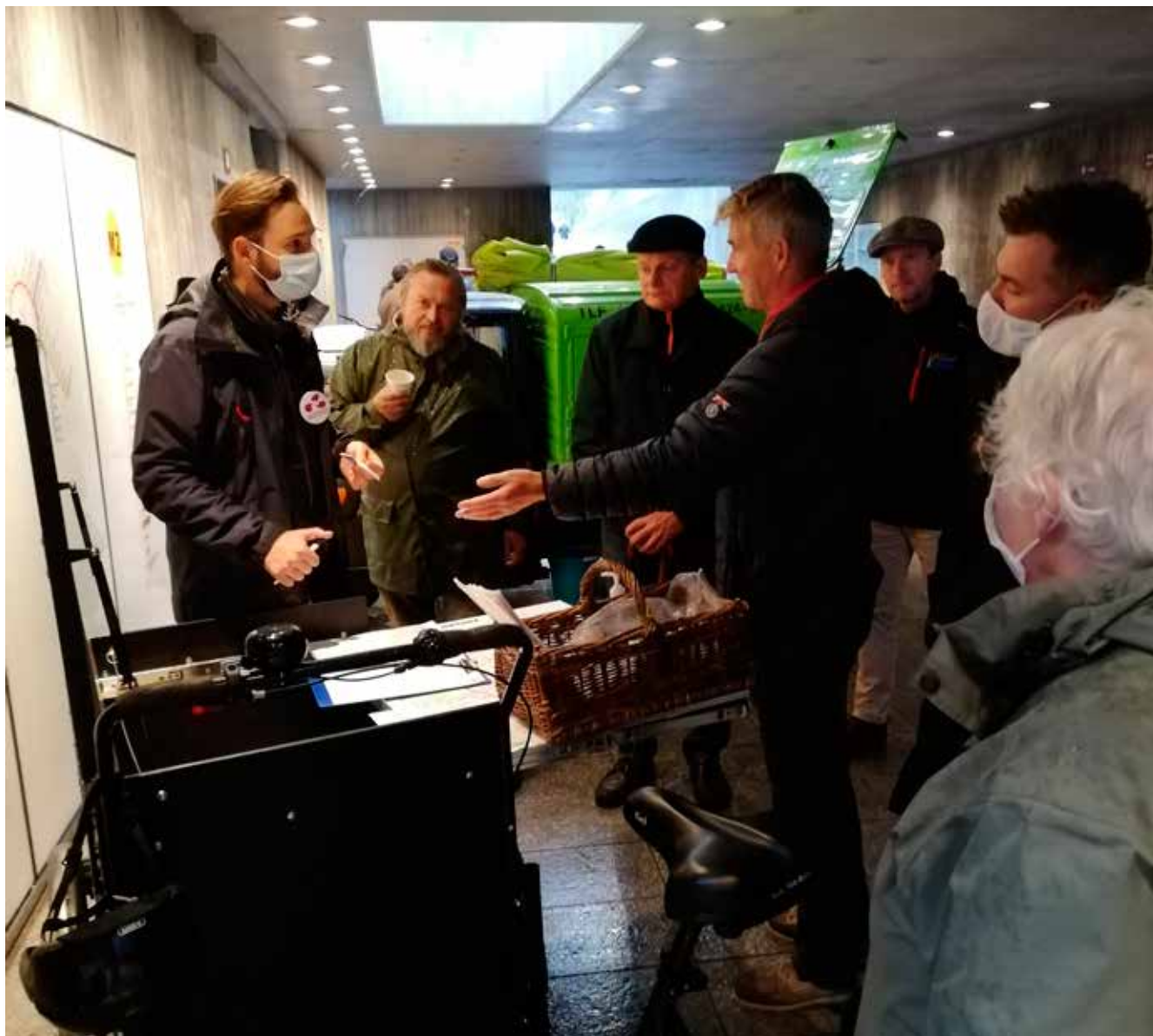
Stor tilslutning til møderne om parkering ved metrostationerne

Borgerne melder om lufthavnsparkeering og pendlerparkeering på de små villaveje ved metrostationerne