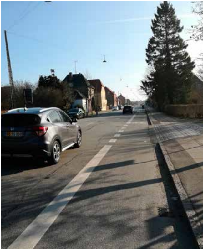
Der køres hurtigt på de lige strækninger på Kastrupvej