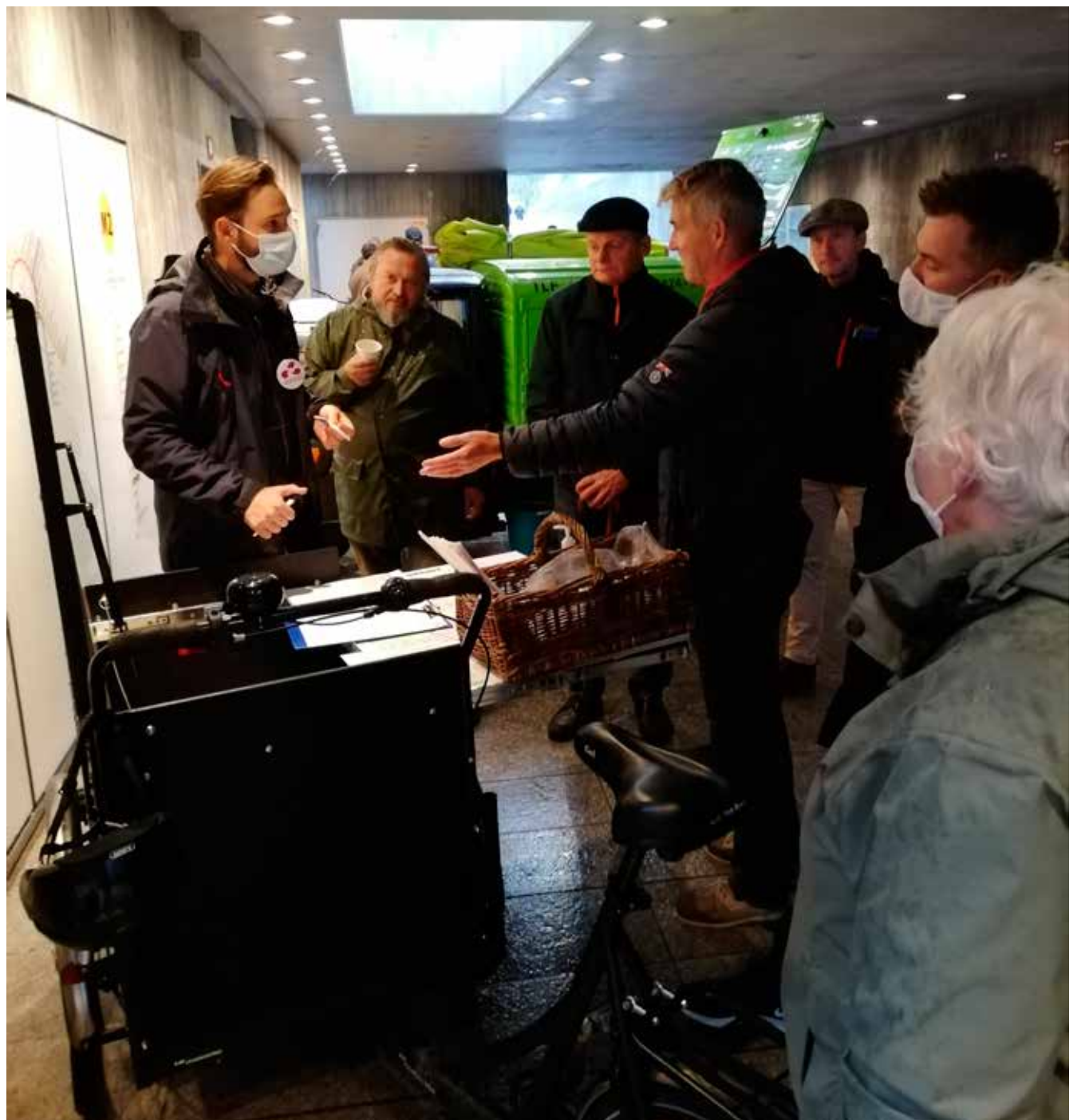
Many local residents participated in the meetings about parking close to metro stations

One of the local committee's most important tasks is to be a link between the local citizens and the politicians at City Hall. We now intend to move forward with the issue in order to raise awareness at the City Hall and to achieve political action on the matter.