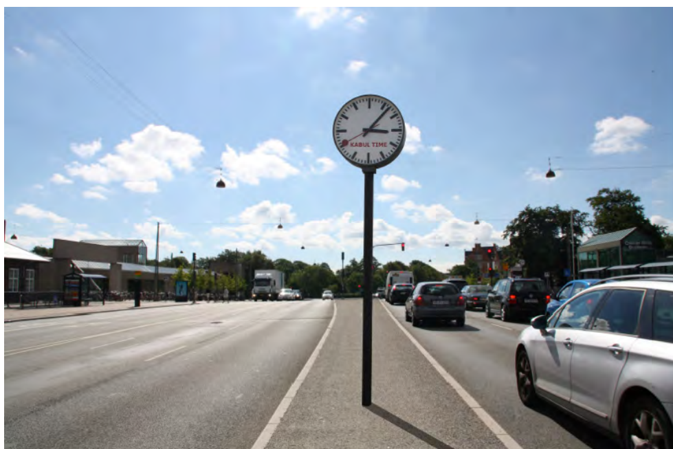
Jens Haaning Kabul Time, 2011

Værket er aldrig blevet realiseret i Danmark, men skulle som et dagligdags element i byrummet placeres et sted, hvor der dagligt passerer tusindvis af trafikanter, som en slags forstyrrende forflytning eller skæv kommentar til det moderne menneskes afhængighedsforhold til tid og til Danmark som del af en global virkelighed. I forbindelse med den midlertidige udstilling Malmö's Leende i september-oktober 2016 blev værket installeret i fjorten dage ved Trianglen Metrostation i Malmø.