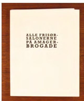
Lasse Krog Møller Alle Frisørsalonerne på Amagerbrogade, 2015