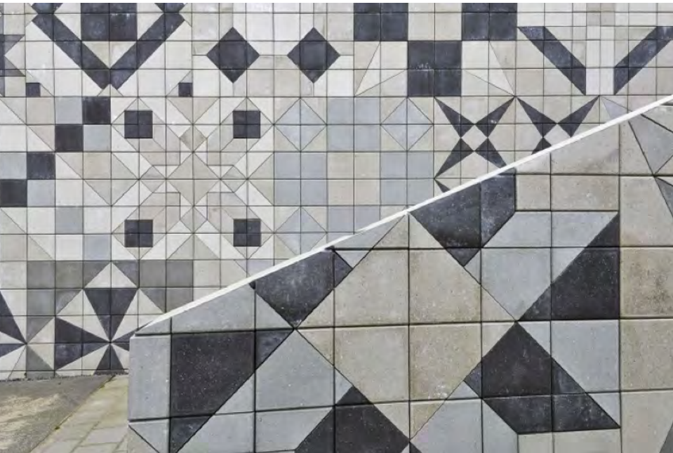
Mette Winckelmann Tro og Overtro, 2013

De to ovenfor nævnte eksempler viser forskellige kunstneriske greb, som hver på deres måde aktiverer den lokale, stedsspecifikke fortid. Fælles for dem er grundig research og interesse i at skabe forståelse og indsigt i den lokale historie gennem henholdsvis midlertidige og permanente markeringer med stærke narrative elementer.