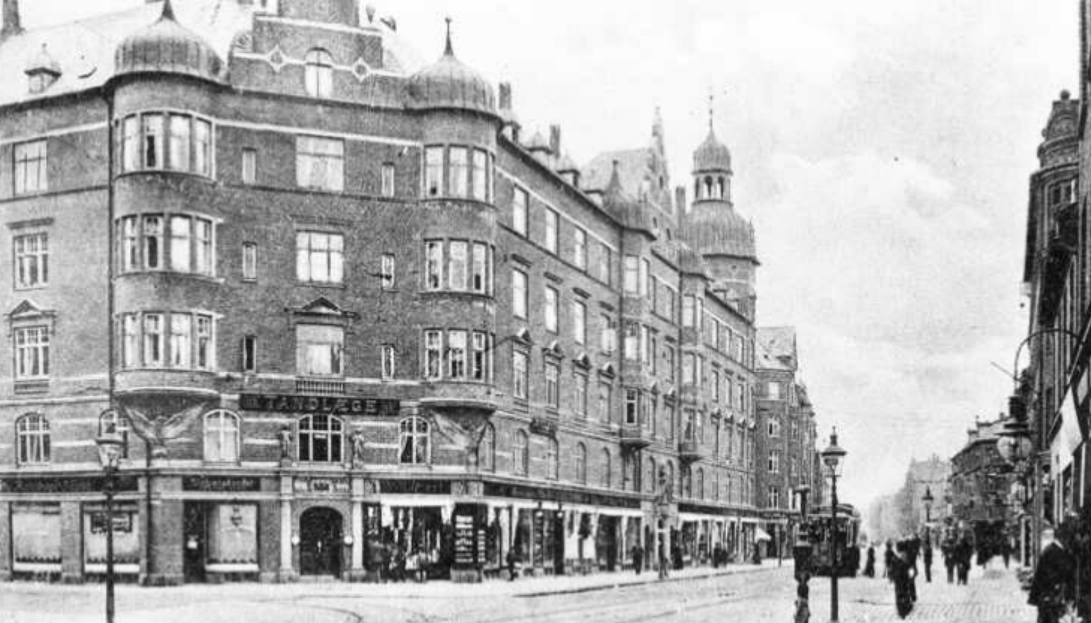
Amagerbrogade ved Holmbladsgade omkring 1910 Ejendommen Fredens Mølle.