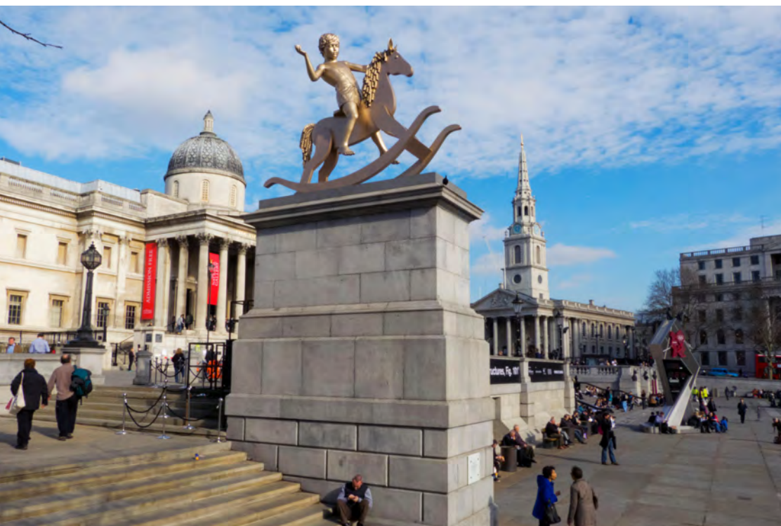
Elmgreen & Dragset Powerless Structures, Fig. 101 med øgenavnet “Golden Boy” Trafalgar Square’s Fourth Plinth afsløret af Joanna Lumley, London, UK, torsdag d. 23. februar 2012

På samme vis kunne Amagerbrogade danne ramme for et forløb af værker, der udskiftes med kortere eller længere mellemrum, for på den måde løbende at sætte fokus på en aktuell problematik, historisk begivenhed eller lignende.