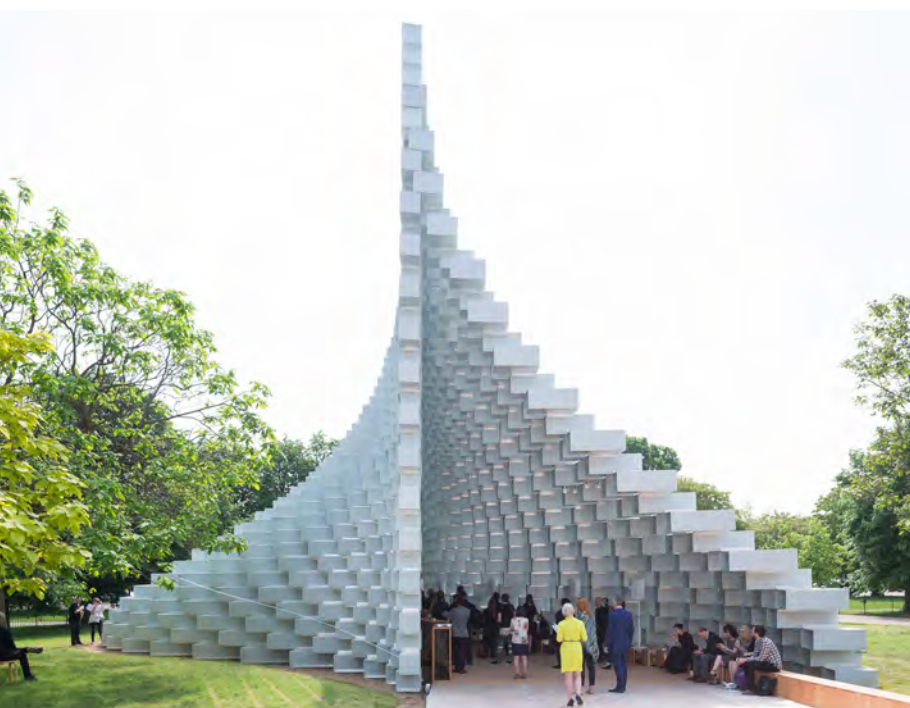
Bjarke Ingels Group / BIG Serpentine Pavillon, 2016 © Bjarke Ingels Group / BIG Foto: Iwan Baan

På tilsvarende vis kan en kunstner omsætte en ældre eller nyere begivenhed eller særlig amagerkansk kultur i en re-enactment og skabe rum for nye perspektiver på det tema, der er omdrejningspunkt for den pågældende re-enactment.