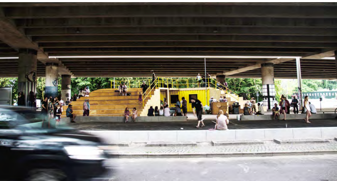
Det udendørs kulturhus Under Buen tegnet af Tegnestuen Platant

I forbindelse med områdefornyelsen Nordre Fasanvej Kvarteret i Frederiksberg Kommune etablerede tegnestuen PLATANT i 2015 et udendørs kulturhus under Bispeengbuen. Projektet blev realiseret i 2015 og eksisterer midlertidigt frem til 2018. I 2016 er det blevet udvidet med et udendørs køkken som supplement til den eksisterende film- og musikscene, en amfiscene, fodboldbane, rutschebane og et skaterområde.