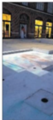
I år bliver der igen vist kortfilm på forpladsen hos K195

Blandt de 10 udvalgte film er der også bidrag fra Danmark.